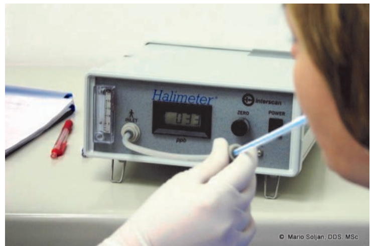
Mundgeruchsmessung mit dem Halimeter und graphische Darstellung